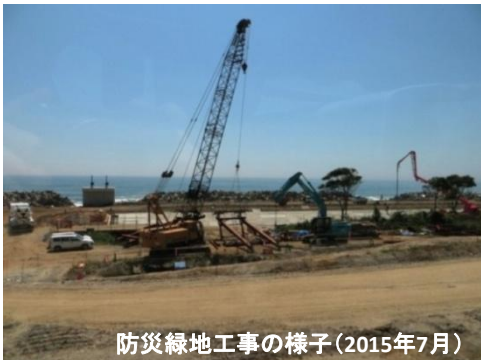
防災緑地工事の様子(2015年7月)